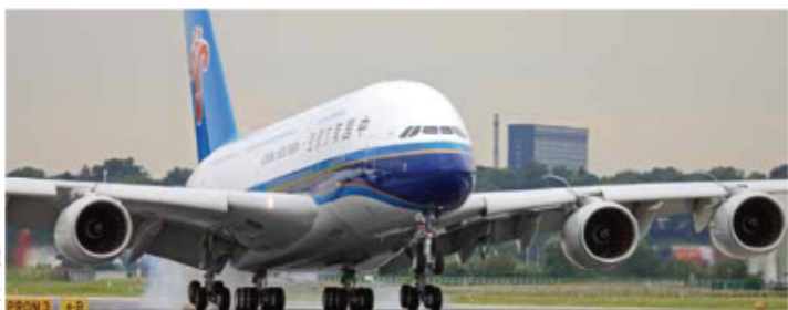
■ DEZE OUDENIEUWE AIRBUS A380 VAN CHINA SOUTHERN AIRLINES, DE ALLEREERSTE VOOR EEN CHINESE LUCHTVAARTMAATSCHAPPIJ, WORDT ONGETWIJFELD EEN VASTE GEBRUIKER VAN BEIJING NEW INTERNATIONAL AIRPORT.

DEN HAAG ■ Acht start- en landingsbanen, 130 miljoen passagiers per jaar, 370 opstelplaatsen voor vliegtuigen en een oppervlakte zo groot als de stad Amsterdam. Dat zijn slechts enkele eigenschappen van de nieuwe megaluchthaven Beijing New International Airport in China. 'Leuk' voor ons Nederlanders: het conceptontwerp van in potentie de grootste luchthaven ter wereld is gemaakt door Netherlands Airport Consultants (NACO) in Den Haag.